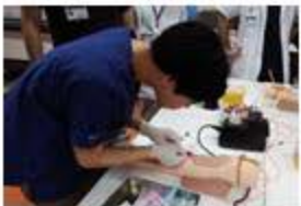
手技は、シミュレーターで何度も練習してから 実際患者さんに対して行います！

日によって異なり、研修医向け共通 研修カリキュラムや、医局でレクチャー が受けて、ほぼ毎日指導医の先生 からの指導が受けられます